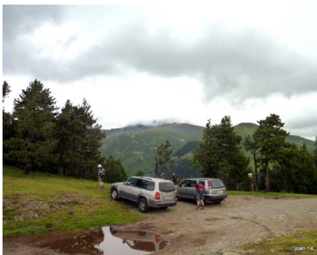
Text: Josep M. Farnés

encara una estona però finalment traiem els impermeables i capel·lins i ens hi emboliquem. Avancem muntanya amunt arrengrerats. Passem pel Roc Blanc i seguim pel costat d'un tancat. Prenem la Serra de Planès o també anomenada la Vaquerissa. Passem pel costat d'unes vaques pasturant. Pensem que no arribarem al nostre objectiu a l'observar el Puigmal notablement emboirat. Possiblement arribarem al Puig de Dòrria o al Pas dels Lladres. Abans d'arribar-hi augmenta la pluja i a les 9 i ¼ després d'una nova reunió, malgrat la nostra tossuderia, desistim. Retornem pel mateix camí fins a l'aparcament. Hi arribem a les 10 i ¼. Decidim anar fins a Ventolà a refugiarnos a ca l'Anna on hi arribem a les 11. Hi fem l'àpat (esmorzar-dinar) i a la sobretaula decidim que la propera setmana anem al Comabona des del Coll de les Bassotes, si el temps ho permet. Sortirem a les 6 dels Gorcs.