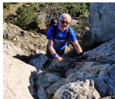
Text: Josep M. Farnés