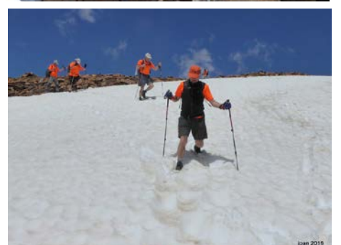
Text: Miquel Maymó