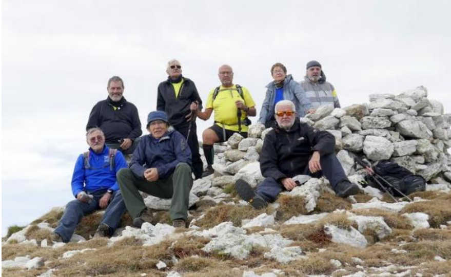
Roca Colom 2506m

https://ca.wikiloc.com/rutes-senderisme/vallter-roca-colom-vallter-116747659