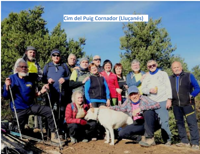
Cim del Puig Cornador (Lluçanés)

https://ca.wikiloc.com/rutes-senderisme/alpens-puigcornedor-125928581