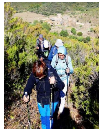
Text: Miquel Maymó Cirera