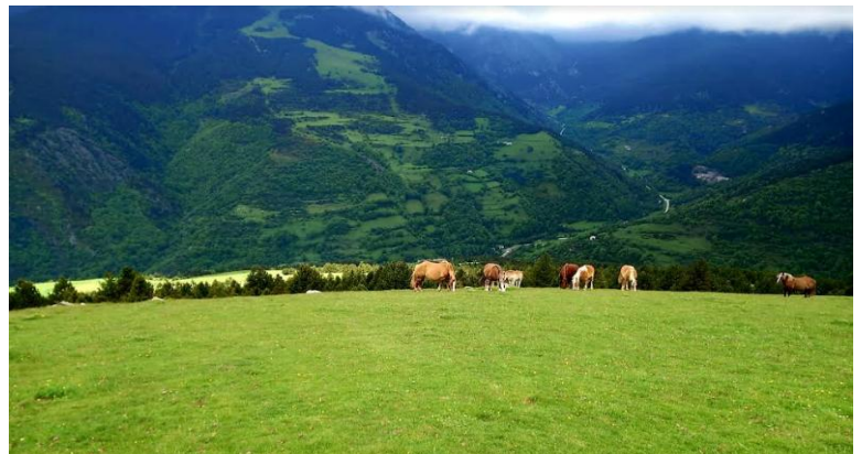
Text: Miquel Maymó Cirera