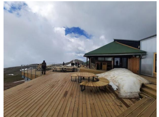
Tex i Trac : Miquel Maymó