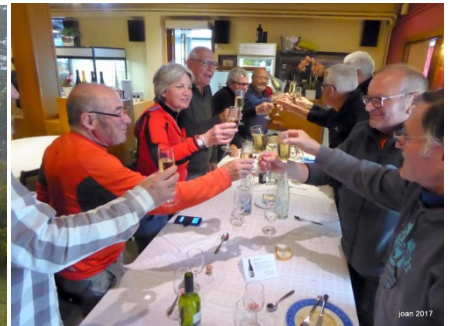
Text: Josep M. Farnés