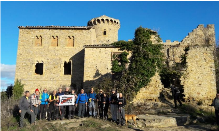
El Clascar, Cingles de Bertí

Distància: 14,54km. Temps: 5,13h. Temps en moviment: 4,02h. Desnivell: 423m+. Temp: 7 graus+. Cotxes: 15km. Josep Carbonell, Jaume Bertran, Ismael Porcar.