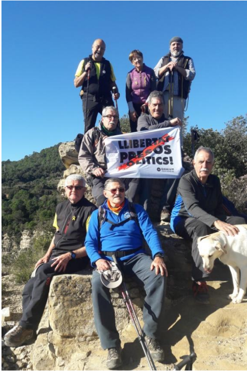
LLIBERTAT PRESOS POLÍTICS des de La Trona