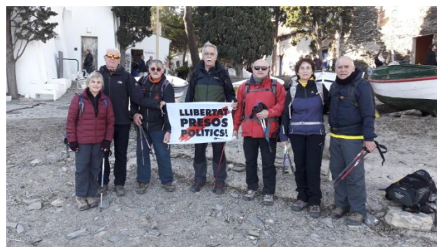
Text i fotografies: Miquel Maymó