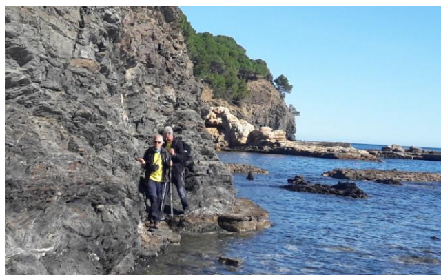
Text: Miquel Maymo