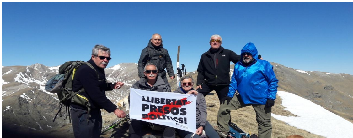
Puig de Fontlletera 2580m

Text: Miquel Maymó