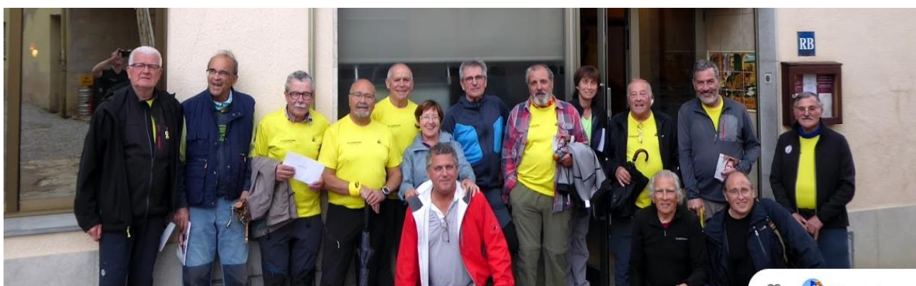
Text: Miquel Maymó