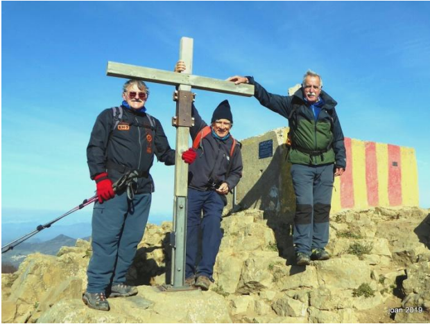
Cim del Puigsacalm 1515m

Distància: 13,06km, Temps: 5,05h Temps en moviment: 3,58h, Desnivell: 658m+, Temp: +5 graus, Cotxe: 75Km, Jaume Bertran.