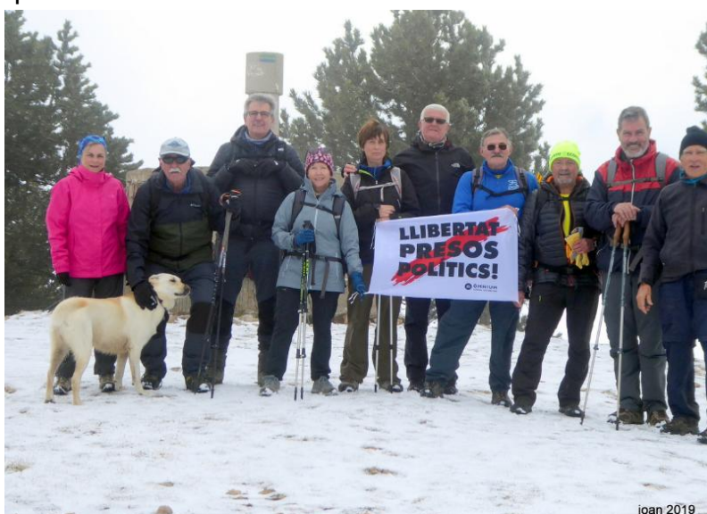
Cim Torre dels Enginyers 1989m Rasos de Peguera

Ens trobem a les 7h del matí, anem direcció a la C17, a Vic agafem la C25, a l'arribar a la C16, parem a Cal Rosal per prendre un cafè i encarregar la taula per dinar. Passem Berga i anem cap al nucli de Espinalbet, seguim fins a l'ermita de la Mare de Déu de Corbera, on aparquem.