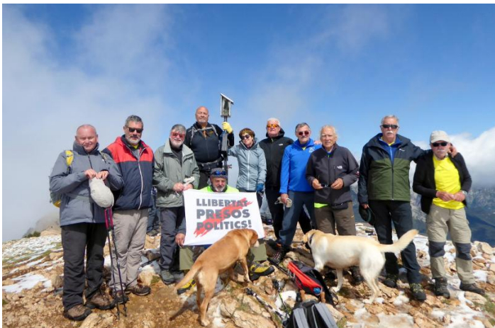
Cim del Cap de la Gallina Pelada 2.321m

Aparquem i ens trobem a quatre caminaires de Vic, que volen fer el mateix que nosaltres. Estem a 1.550 m i una temp. de 4 graus+, la serra D'Encija està molt blanca, són quarts de nou i el dia és assolellat. Comencem amb una forta pujada, a l'arribar a 1.800 m comencem a trobar neu, i als 2.000 m quasi no es veuen les marques, el corriol ha desaparegut, seguim les petjades dels de Vic, que estan per davant nostre. A l'arribar al coll del Pla D'Encija tot està nevat, estem a 2.250 m, fem fotos i planegem direcció al Refugi D'Encija, ens creuem amb els de Vic que ja tornen. Ens recomanen baixar pel Coll de Fumanya més llarg però amb menys pendent. Fem el cim del Cap de la Gallina Pelada 2.321 m a les 11h. Esmorzem i un noi de Berga que ja hem coincidit en altres sortides ens fa la foto reivindicativa LLIBERTAT PRESOS POLÍTICS.