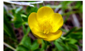
Text: Miquel Maymó