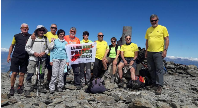
Cim del Puigmal 2.910m

Distància: 15,6km Temps: 9,09h Temps en moviment: 5,44h Desnivell: 1.090m+ Temp: 15 graus Cotxes: 115km, Jaume Bertran, Josep Roca.