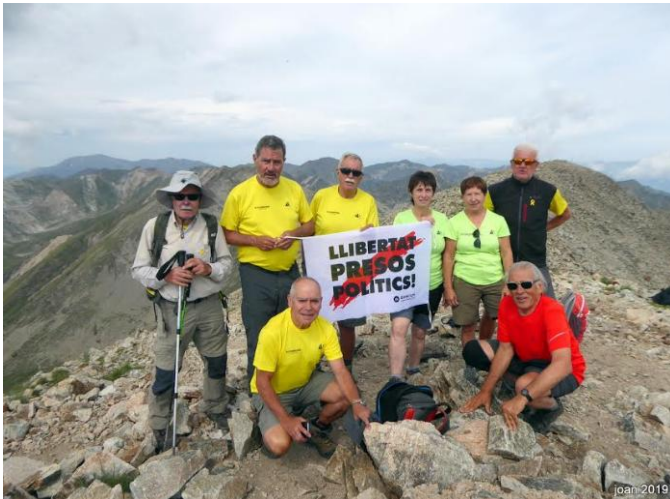
Cim de Bastiments 2.883m

Sortim a les 6h del matí de l'àrea esportiva de Corró de Vall, anem cap a la C 17 a Ripoll girem cap a Sant Joan de les Abadesses, hi parem a el cafè. Seguim fins Vallter 2.000, aparcuem i ens preparam per fer la sortida. Estem a 2.150m+ són tres quarts de nou, hi ha 12 graus i el dia