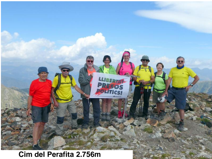
Cim del Perafita 2.756m