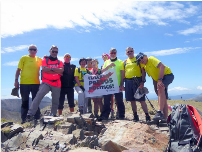
Pic del Noufonts 2.861m

Distància: 12,9km Temps: 5,41h Temps en moviment: 4,07h Desnivell: 1.037m+ Temp: 8 graus . Cotxe: 95km Miquel Maymó, Josep Pous, Josep Carbonell.