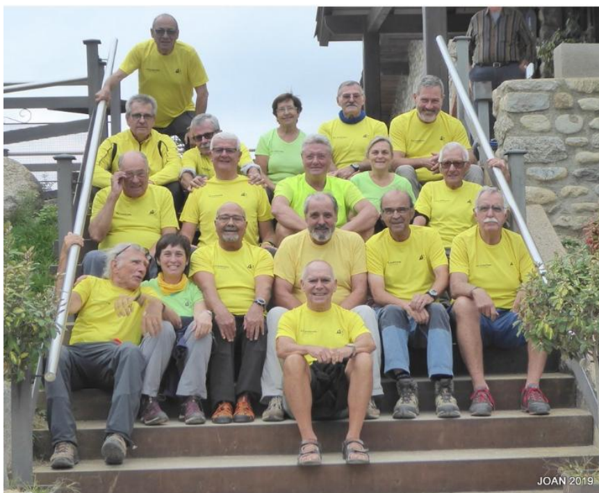
Foto de Grup Els Ginesters