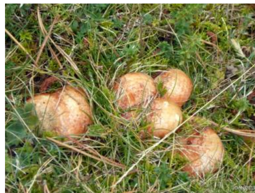
Text: Miquel Maymó