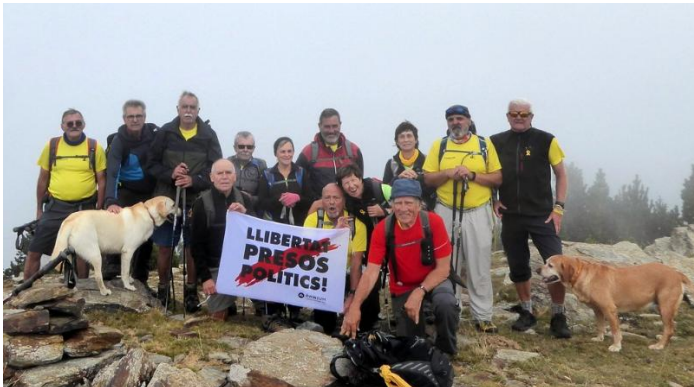
Puig de les Agudes 1.976m Setcases

Distància: 9,82km. Temps: 5,52h. Temps en moviment: 3,17h. Temp: 11graus. Desnivell: 742m+. Cotxes: 112 km, Jaume Bertran, Ismael Porcar, Julià Llobet, Josep Roca.