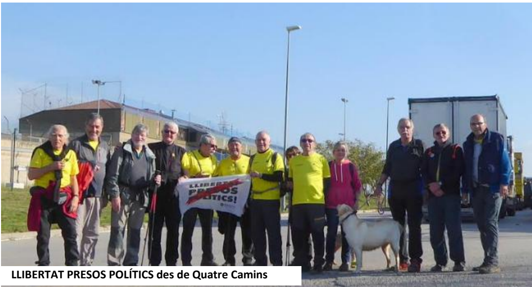
LLIBERTAT PRESOS POLÍTICS des de Quatre Camins

de can Malo, fins l'Holtel Augusta, girem a l'esquerra i pugem pel bosc de can Pla, fins dalt el turó.