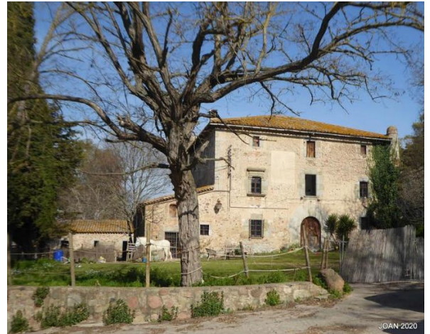
Can Congustell (Valldoriolf)