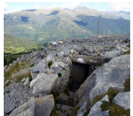
Text: Miquel Maymó