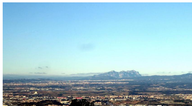
Txet: Miquel Maymó