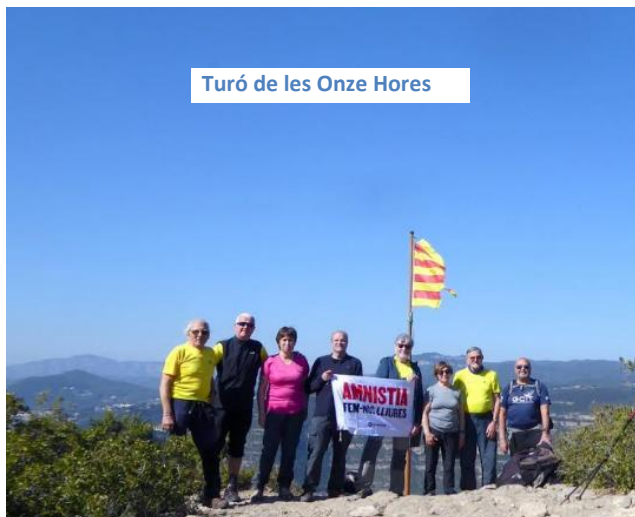
Turó de les Onze Hores