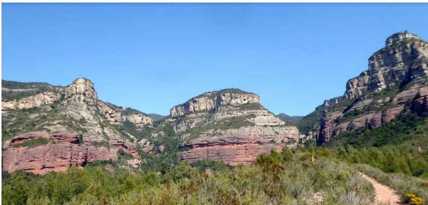
Text: Miquel Maymó Cirera