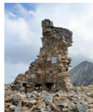
Refugi vell de Ulldeter