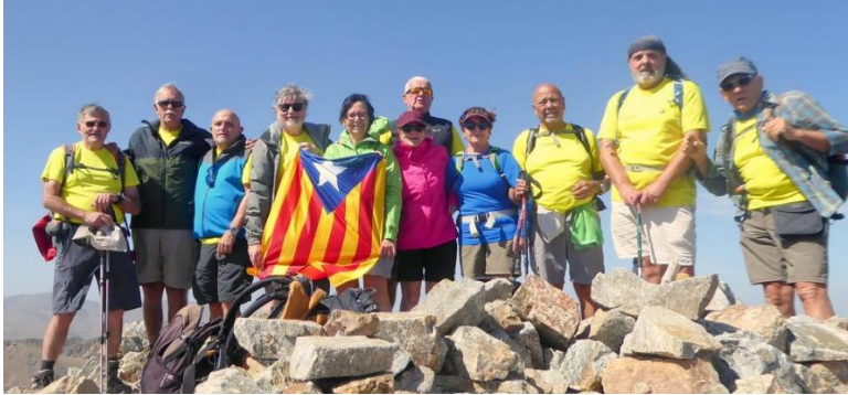
Pic de l'Infern 2.870m